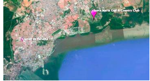
Ciudad de Panamá

⇒ Se evaluaron impactos y se crearon procedimientos de mitigación para: